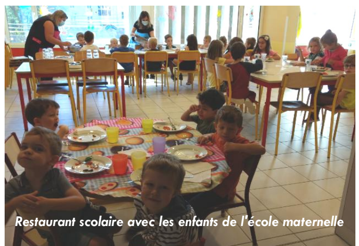
Restaurant scolaire avec les enfants de l'école maternelle