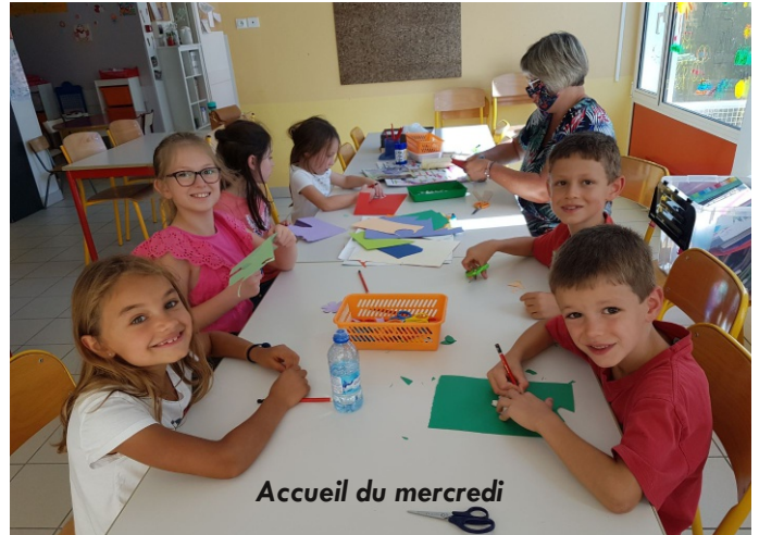
Accueil du mercredi

Les services d'accueil étaient aussi ouverts ce jour-là. Si personne ne s'est présenté à l'accueil du matin, 26 enfants étaient inscrits le soir. Dès le jeudi, les deux services avaient retrouvé leur rythme de croisière : 30, le matin ; 50, le soir ! Cette année tous les enfants sont accueillis dans les locaux du