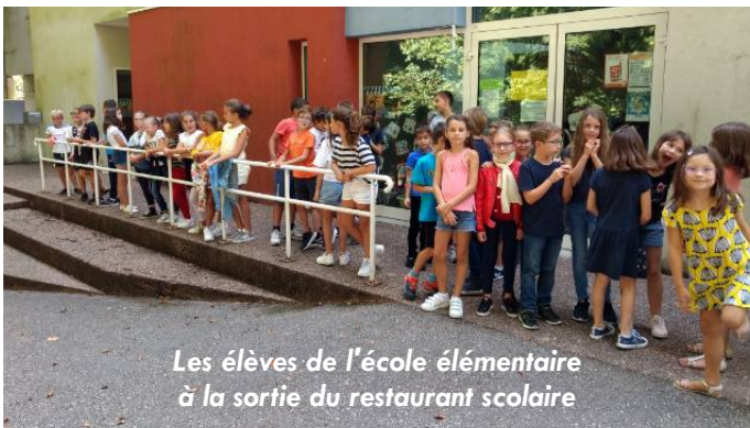
Les élèves de l'école élémentaire à la sortie du restaurant scolaire

restaurant scolaire le matin. Mais, petit changement pour le soir : les activités se déroulent dans les mêmes locaux pour les élèves de maternelle, pour les autres, toutes les animations sont prévues dans les différents bâtiments communaux situés place Viansson où les parents doivent les récupérer.