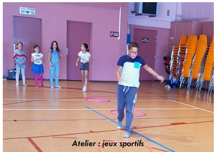
Atelier : jeux sportifs