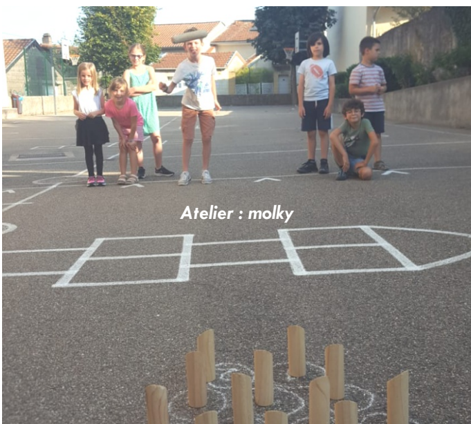
Atelier : molky