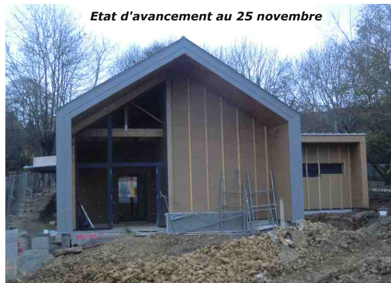
Etat d'avancement au 25 novembre

enfants de la crèche pourront investir leur nouvel espace pendant les vacances de février.